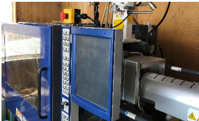
サンプル提供時の射出成型機 住友重機製：SH50A-N VI